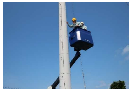
■ 地際から高所にわたる外観調査