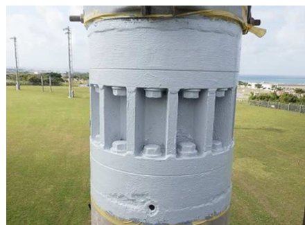
■ 継手部の防錆塗装(発錆対策)