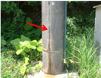
■ コンクリートのひび割れ