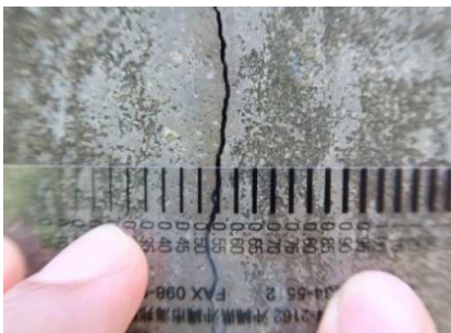
■ ひび割れ確認(クラックスケール)