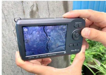
■ ひび割れ確認(デジタル顕微鏡)