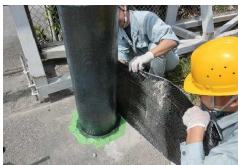
■ 繊維シート補修工法(ひび割れ対策)